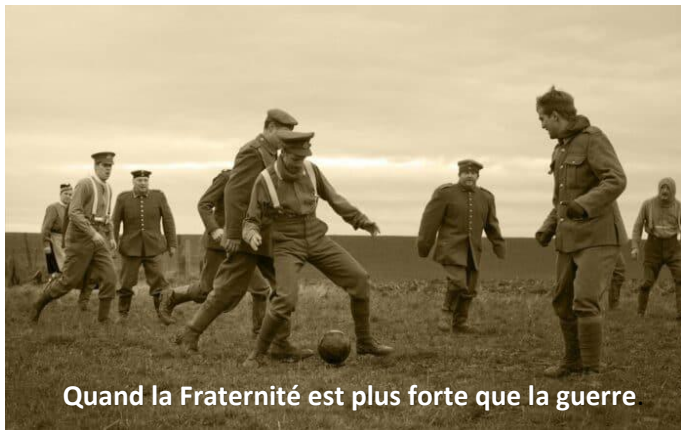
Quand la Fraternité est plus forte que la guerre

Alors que la Première Guerre Mondiale avait débuté depuis quelques mois, des soldats des deux lignes de front ont baissé leurs armes, entonné des chants de Noël et commencé à jouer au football dans le No Man's Land.